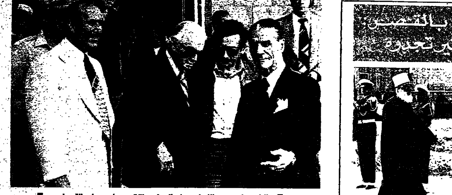
الرئيس شمعون والشخ يسار الجميل والتائب مسكين في القصر امس

كان السيد عبد الحليم خدام نائب رئيس الوزارة وزير الخارجية السورية ما يزال في قصر بعبدا ، عندما استقبل الرئيس ترقية عدداً من الوزراء العسكريين والوزراء السياسيين ، للتشاور معهم في الوضع الداخلي . وقد شارك الوزير السوري في جانب من الاجتماع مع الرئيس جميل شمعون والشخ يسار الجميل . وابرز الذين زاروا القصر الجمهوري منذ الصباح ، كانوا وزير الدفاع العماد اسكندر غانم ، وزير الاعلام العماد سيد نصرالله ، وزير الخارجية السيد فرسان حداد ، ثم ساحة للشخ محمد ابو خنفر . اجتماع المجلس الامن وقد وصل العماد غانم في الثامنة والربع ، وتبعه بعد خمس دقائق العماد نصرالله ، ثم وصل السيد جول بستاني رئيس اللجنة الثانية ، والسيد هشام الشعار مدير عام قوى الامن الداخلي . وقد اجتمع المجلس الامن ، برئاسة الرئيس مسكين ، في الساعة العاشرة ، في القصر الجمهوري ، وشارك في الاجتماع كل من الرئيس مسكين ، وزير الدفاع العماد سيد نصرالله ، وزير الاعلام العماد سيد نصرالله ، وزير الخارجية السيد فرسان حداد ، ثم ساحة للشخ محمد ابو خنفر .